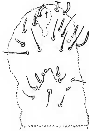
FIG. 1. — Xenylogastrura venezueliensis n.sp., articles antennaires III et IV.

Antennes petites (57 µm), 0,8 fois plus courtes que la diagonale céphalique. Rapports articles antennaires I : II : III : IV = 1 : 1,2 : 1,36 : 1,6. Articles antennaire I et II avec, respectivement, sept et douze soies. Articles antennaires III et IV sans séparation nette. Organe sensoriel de l'article antennaire III classique du genre, avec deux microsensilles globuleuses, cachées partiellement par un repli régimentaire et encadrées par deux sensilles de garde plus longues et cylin-